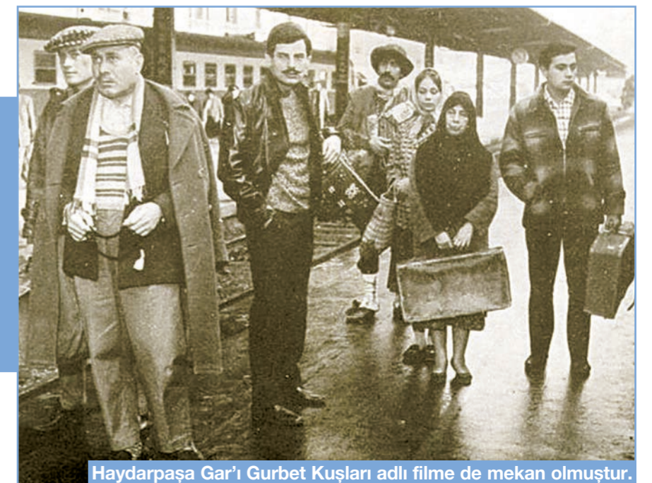
Haydarpaşa Garı' Gurbet Kuşları adlı filme de mekân olmuştur.